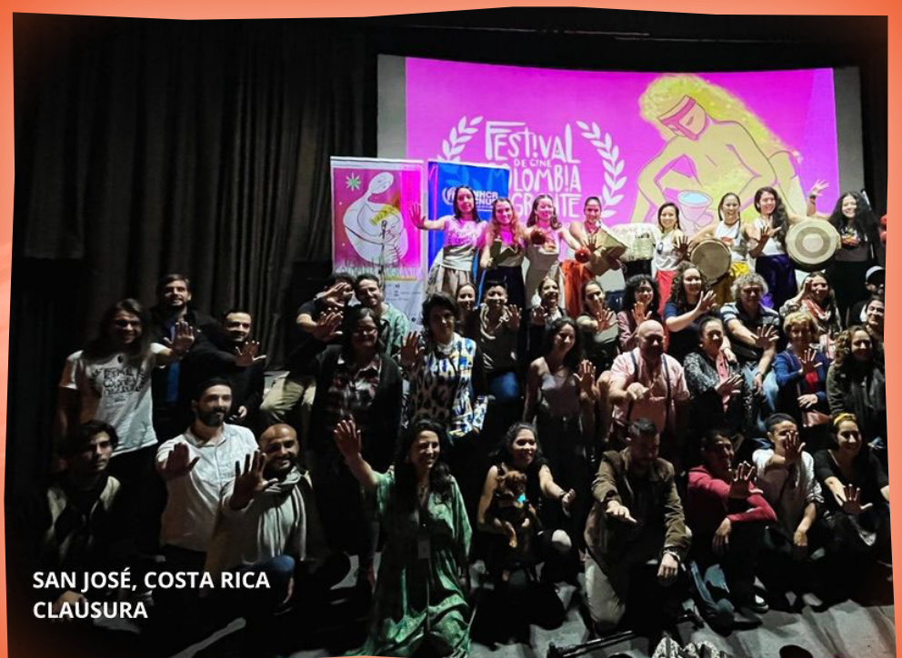
SAN JOSÉ, COSTA RICA CLAUSURA