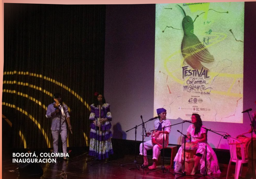
BOGOTÁ, COLOMBIA INAUGURACIÓN

En el siguiente link se pueden observar un compilado de nuestra primera versión: